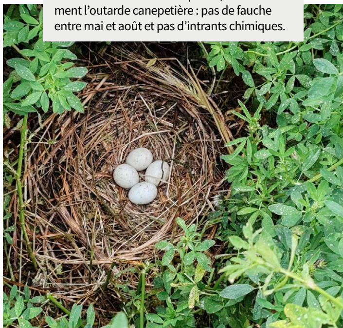
Nid de busard cendré

Ainsi, ce travail en concertation avec un des acteurs du territoire bénéficie à la préservation de deux espèces emblématiques du site Natura 2000, l'outarde canepetière et le busard cendré !