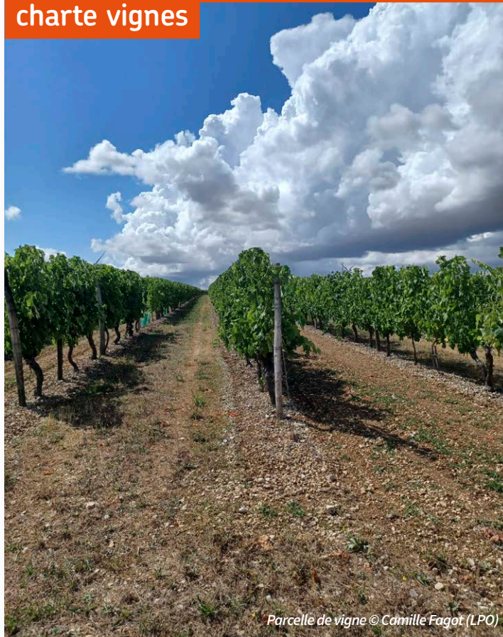
Parcelle de vigne

Une mise à jour de la charte vignes du site Natura 2000 a été soumise à un vote dématérialisé durant tout le mois de janvier 2026, après 1 an de réflexion et de rédaction avec le groupe de travail restreint.