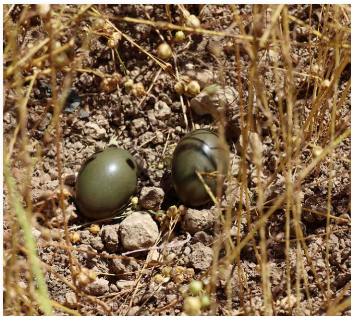
Nid d'outarde dans une parcelle de lin

Une femelle équipée d'un GPS a fait deux nids mais le premier n'a pas été jusqu'au terme, certainement à cause d'un prédateur. La deuxième couvée de 2 œufs a permis à un poussin d'éclore et de devenir adulte. Ce dernier aurait été aperçu au rassemblement d'automne avec la femelle équipée. Un autre nid a également été trouvé grâce au drone. Cette nichée de 3 œufs, trouvée dans une parcelle de luzerne Durepaire, a pu être protégée grâce à l'accord de l'agriculteur.