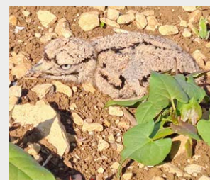
Réponse : Je suis un poussin d'edcicnème criard !

Je suis un oisillon. Mes parents se ressemblent beaucoup et font leur nid sur un sol nu avec des cailloux, là où poussent les tournesols, le maïs ou la vigne.