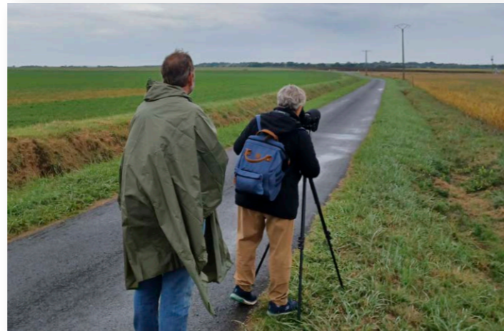
Sortie grand public de 2026 à Ranville-Breuillaud (en haut), et sortie grand public de 2025 à Mons (en bas)